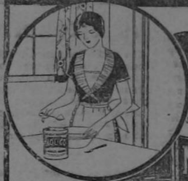
EMPLEE LA QUE NECESITE