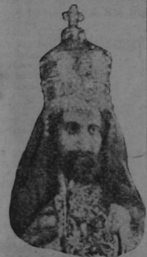
EMPERADOR HAILE SELASSIE

JERUSALEM, 21.—Acompañado de su séquito saldrá próximamente, hacia Londres, el emperador Haile Selassie.