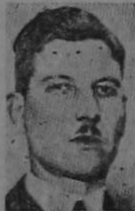
Dr. SCHUSCHNIGG Canciller de Austria

VIENA, 21.—Ha sido promulgada una ley denominada